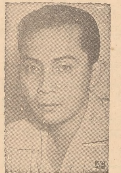
SJAHIR Minister-President Indonesië.

Reuter meldt dat de nieuwe staat West Java Zondag a.s. zal worden uitgeroepen. De partij zou een miljoen leden tellen. (Aneta, 30.4.)